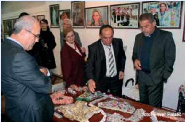
Posjetitelji u razgledanju izložbe

povijesti i sudbine koji su uz njih povezani. O bogatstvu izloženih primjeraka, kojima je prikazana multikulturalnost i multietničnost Kosova, najbolje svjedoče fotografije na kojima se vidi da