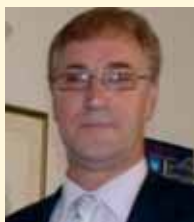
Priredio: Enis Dugonjić