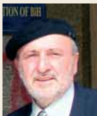
Piše: Adem Smajić