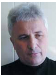
Piše: Ibrahim Ružnić

K ako je plan da u ovom broju Bošnjačkog glasa predstavimo četvoricu najavljenih kandidata za za-stupnika u Saboru RH iz redova pripadnika bošnjačke nacionalne manjine, te da list bude tiskan i distribuiran makar tjedan dana prije izbora kako bi se naši čitatelji mogli što