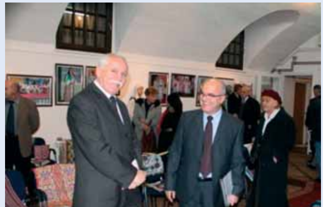
Posjetitelji u razgledanju izložbe