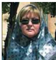
Piše i fotografira: Mira Pavlaković

O svemu ćete biti na vrijeme izviješteni!!