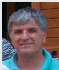
Piše: Zemir Delić