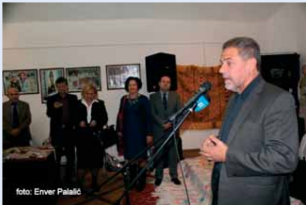
Gradonačelnik Zagreba Milan Bandić za govornicom