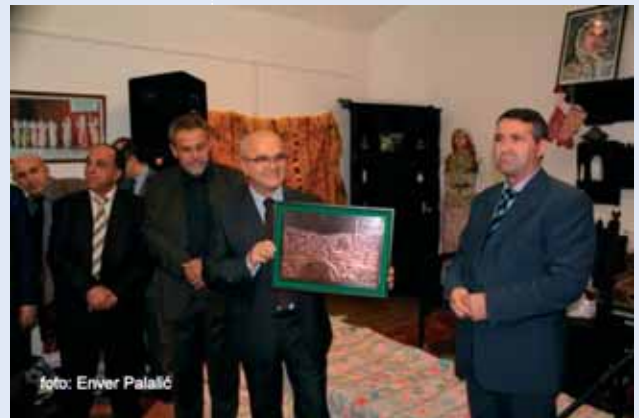
Bakrorez "Prizren" – poklon za BNZ ZG i ZGŽ