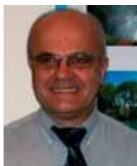
Tekst: Sead Berberović