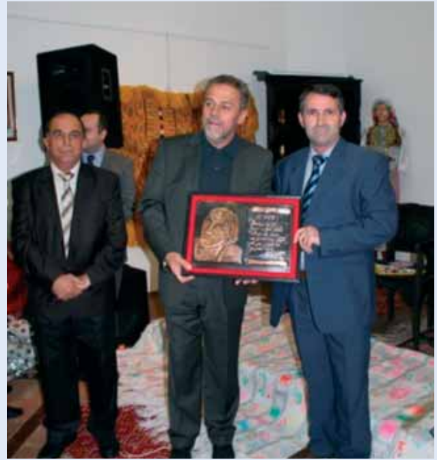
Bakrorez "Majka Tereza" - poklon za gradonačelnika Milana Bandića